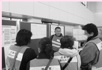
ボランティア受入れ(活動紹介・マッチング)