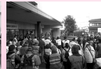
スタッフ打ち合わせ