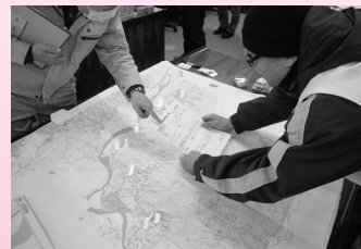
地図記入(富士川支部)