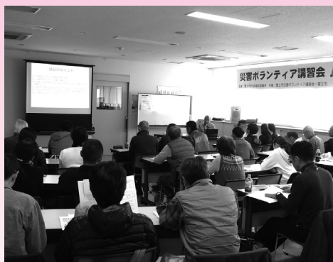
災害ボランティアの基礎知識

富士市社会福祉協議会は、近年頻発している様々な災害に備え、自身を守るための方法や災害ボランティアに関する基礎知識などを学ぶための災害ボランティア講習会を開催しています。今年度は計4日間の日程を40名の方に受講していただきました。