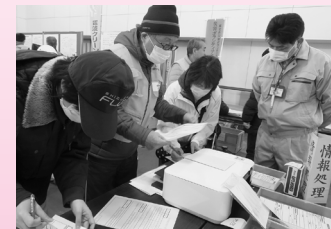
情報収集・情報処理