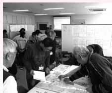
避難所運営ゲーム(HUG)