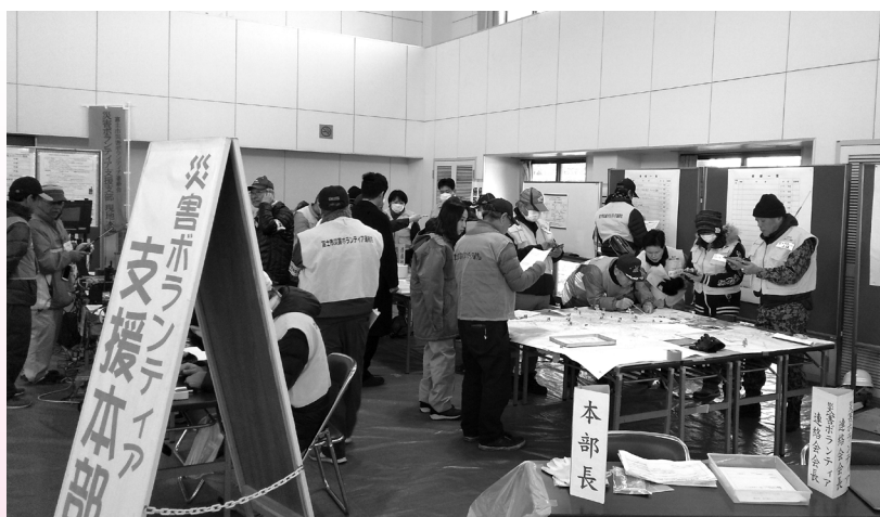
災害ボランティア支援本部

当日は、フイフセに災害ボランティア支援本部、富士川ふれあいホールに富士川支援支部を立ち上げ、訓練を行いました。スタッフと一般参加者を合わせ約300名のご参加をいただきました。ご協力ありがとうございました。