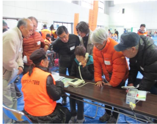
災害伝言用ダイヤル 171体験