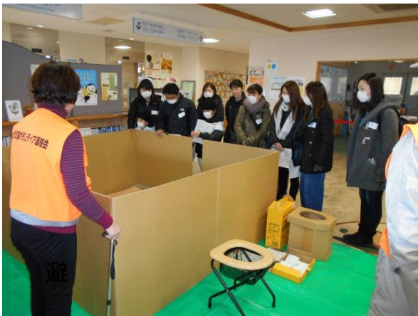
避難所体験（段ボール間仕切り）