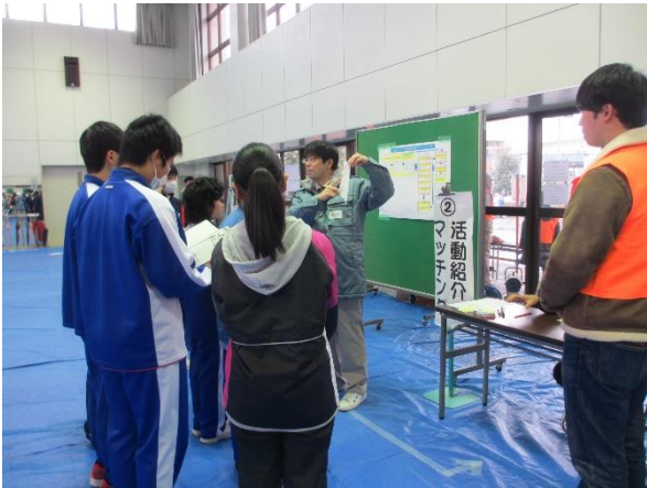
災害ボランティア受入れ訓練（活動紹介）