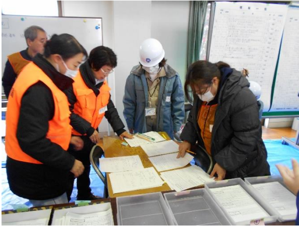
情報訓練（情報処理）