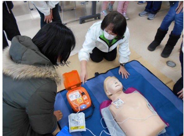
応急救護 A E D体験