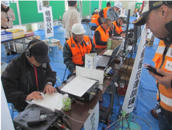
無線伝達訓練体験