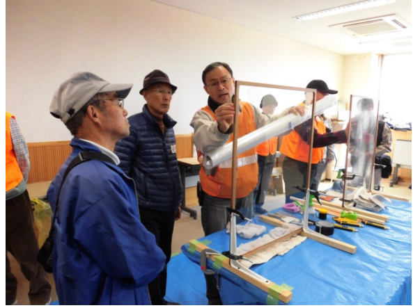
フィルム貼り体験